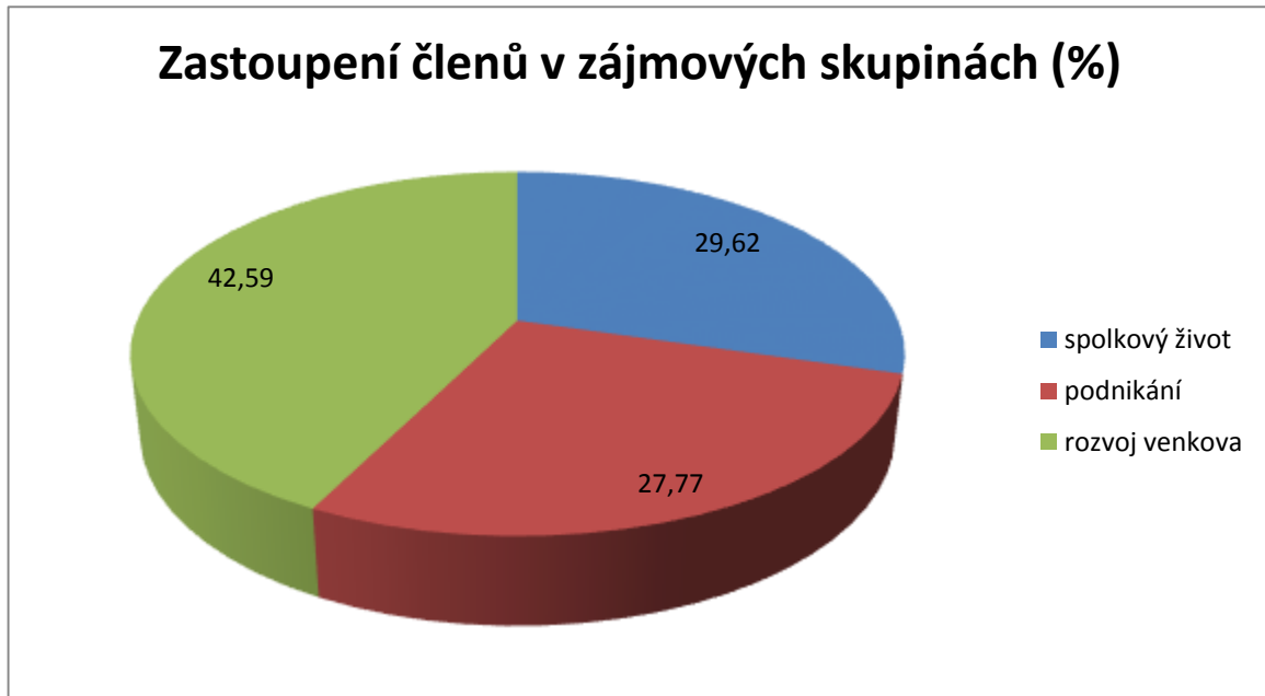
Graf 1: Zastoupení členů v zájmových skupinách